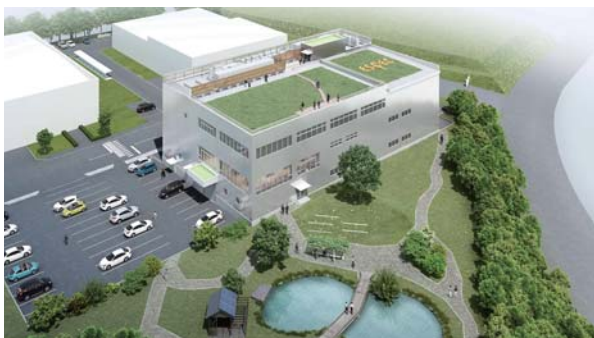
新技術開発棟 全景(イメージ図)

神戸R&Dセンター(兵庫県神戸市北区)の敷地内において新技術開発棟の建設に着工しました。産学官連携など、オープンイノベーションの促進により技術開発力を強化するとともに、生物多様性保全の推進を図り、持続的な成長を目指します。屋上には、六甲北部の在来種による草地を育成し、既存のエスプレックの森(在来苗木を植樹し育てた森)やビオトープなどとの調和を図ります。新技術開発棟は、2020年5月より稼働する予定です。