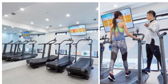
高地トレーニングスタジオ「30peak 芦屋」

兵庫県芦屋市にオープンした高地トレーニングスタジオ「30peak 芦屋」に低酸素発生装置を納入しました。低酸素発生装置は、当社独自の「環境創造技術」により、高地の低酸素環境を再現する装置です。低酸素環境で運動することで心肺機能や運動能力の向上を図る「高地トレーニング」を行うことができます。30peak 芦屋では、標高2,500m相当の低酸素環境を再現。短時間でより効果的なトレーニングが可能で、利用者の健康増進などに役立てられています。