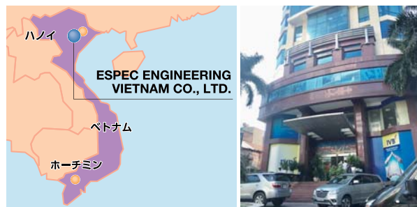
ESPEC ENGINEERING VIETNAM CO., LTD.

ベトナムのハノイに製品メンテナンスや予防保全などのテクニカルサポートを行う新会社「ESPEC ENGINEERING VIETNAM CO., LTD.」を設立しました。近年ベトナムでは、エレクトロニクスや自動車関連企業の投資が活発化しています。当社は、中期経営計画「プログレッシブ プラン2021」においてASEANを重点拡大地域と位置づけています。ベトナムでの新会社設立により、テクニカルサポート体制を強化し、ASEAN地域のお客さまにより良いサービスを提供してまいります。