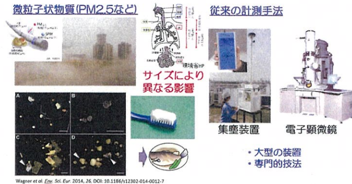
図1. PM2.5 の現状と従来の計測手法。

PM2.5 などのマイクロメートル以下のサイズを持つ微小粒子状物質は、生体に対して健康被害をもたらすことから、大気汚染の原因の一つとなっている(図1)。ぜんそくやその他のアレルギー疾患など、具体的な疾病に関する報告も多数集まっており、大気中に長時間・長距離浮遊することから近年では