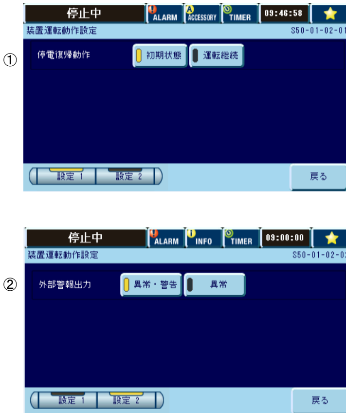
表 5.11 装置運転動作設定項目

装置運転中に停電した後の復帰処理方法、警報発生時の動作の設定を行います。 メンテナンス設定画面の[装置運転動作設定]を押します。