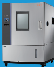
ハイパワー恒温恒湿器