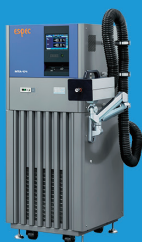
スポット冷却加熱装置