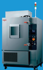
二次電池充放電専用恒温槽