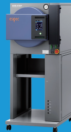
高度加速寿命試験装置 (HAST)