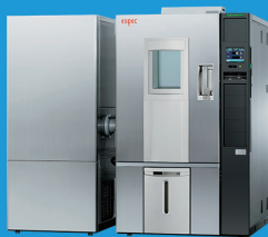
低湿度型低温恒温恒湿器