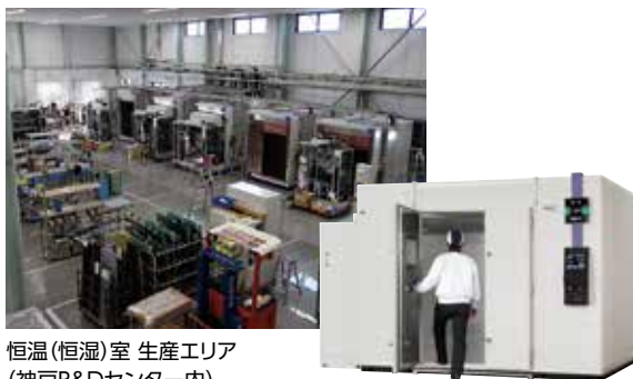
恒温 (恒湿) 室 生産エリア (神戸R&Dセンター内)

恒温 (恒湿) 室の生産エリアを新設し、生産能力を増強しました。当社の主力製品である恒温 (恒湿) 室は、自動車や大型の工業製品が入る部屋タイプの試験室です。近年、加速する自動車の電動化・自動化の技術開発を背景に、国内および中国、ASEANにおいて需要が拡大しています。こうした状況に対応し、神戸R&Dセンター (兵庫県) の敷地内に恒温 (恒湿) 室の生産エリアを新設しました。2018年10月より本格稼働しており、生産能力は2017年度比で1.6倍となりました。併せて、これまで福知山工場 (京都府) と本社 (大阪市) に分散していた設計、調達、生産、検査、物流機能を神戸R&Dセンターに集約しました。これによりお客さまの試験ニーズにより早くフレキシブルな対応が可能となりました。