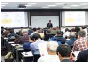
個人投資家向け会社説明会