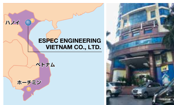
ESPEC ENGINEERING VIETNAM CO., LTD.

今後もASEAN地域におけるお客さまの期待に的確にお応えすることで、環境試験事業のさらなる拡大を目指してまいります。