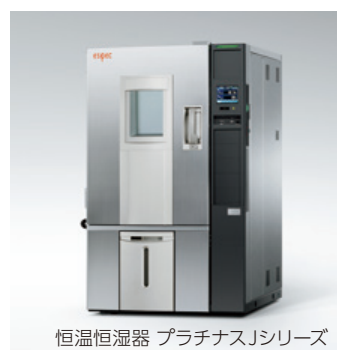
恒温恒湿器 プラチナスJシリーズ