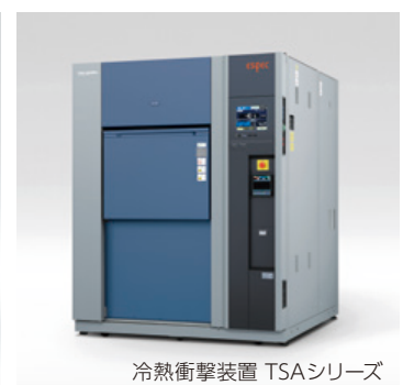
冷熱衝撃装置 TSAシリーズ