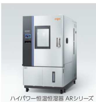
ハイパワー恒温恒湿器 ARシリーズ