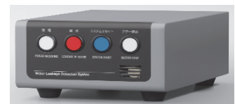
漏水検知ユニット(ボックスタイプ)