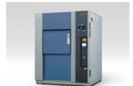
冷熱衝撃装置 TSAシリーズ