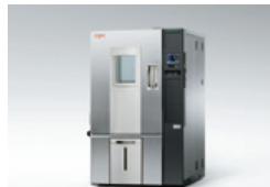
恒温恒湿器 プラチナスJシリーズ