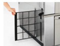
凝縮器フィルター

凝縮器・水回路の汚れは能力低下や消費電力の増加につながります。点検時に清掃・整備をおこない、消費電力を抑えます。