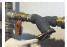
冷却水用フィルター