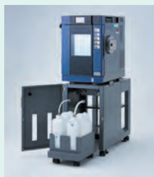
■ 給水タンク付架台