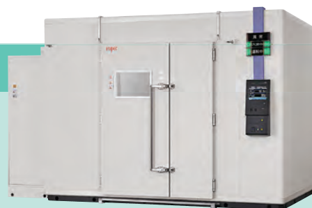
ビルドインチャンバー