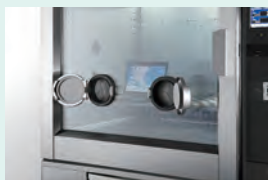
■ 操作孔付ワイドビュー扉