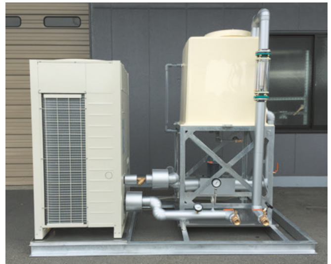
空冷インバーターチラーユニット